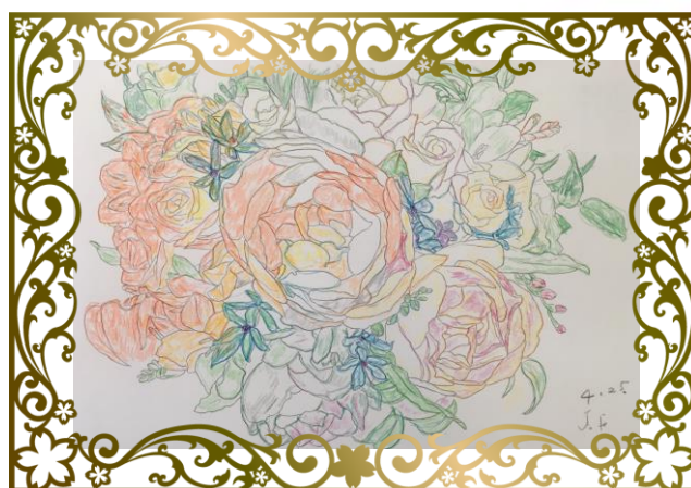
色鉛筆画 バラ (F・J様)